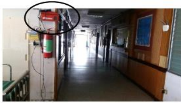
หน้าห้องผู้ป่วยใน