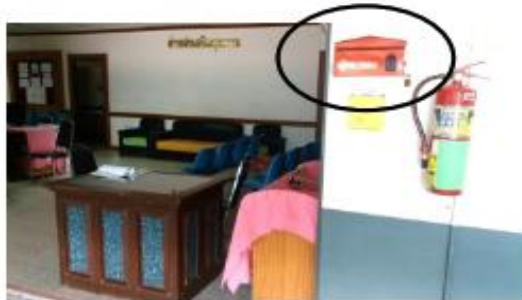
หน้าห้องงานเวชปฏิบัติครอบครัวและชุมชน