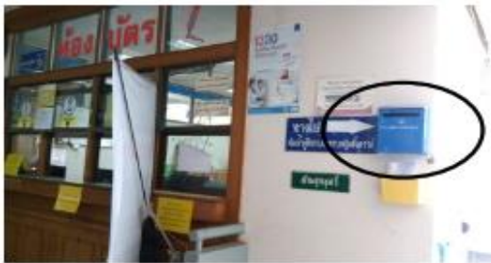
หน้าห้องบัตร