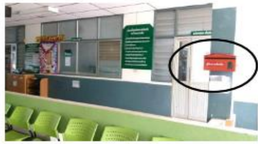
หน้าห้องคลอด